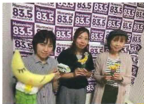
写真:FM宝塚ホームページ番組ブログより