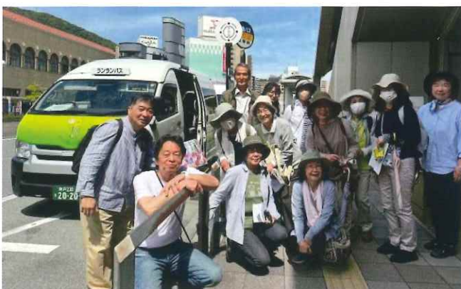
2024年6月 ようこそ月見山・長寿ガ丘へ！

「みんなでまち歩き」 ランランバス～仏舍利塔～丁字ヶ滝 主催:宝塚第一小学校区まちづくり協議会 地域交流部会