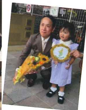
可愛いプレゼンターからフクユ様へ

JR西日本宝塚駅、エフエム宝塚、宝塚第一小学校区まちづくり協議会、宝塚市、株式会社フクユの皆様と、地域ランランバスを守る会 10月2日 於:JR宝塚駅前バス停